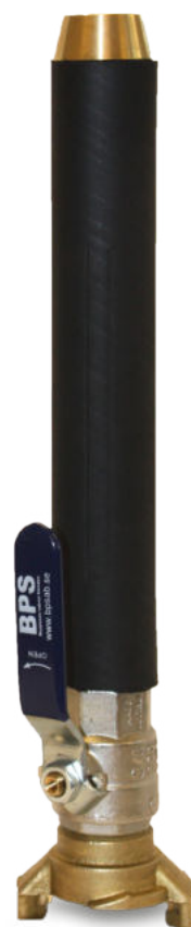
BPS 9002 Spolmunstycke Kiruna modell: extra lång Med större diameter = högre kapacitet