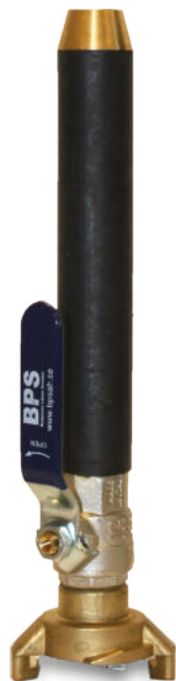
BPS 9001 Spolmunstycke Kiruna modell: lång