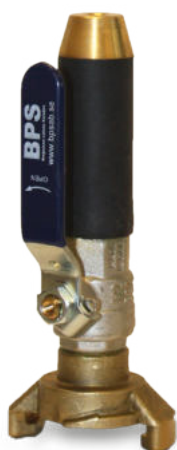
BPS 9000 Spolmunstycke Kiruna modell: kort