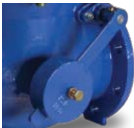
Motvikt Counter weight Gegengewicht